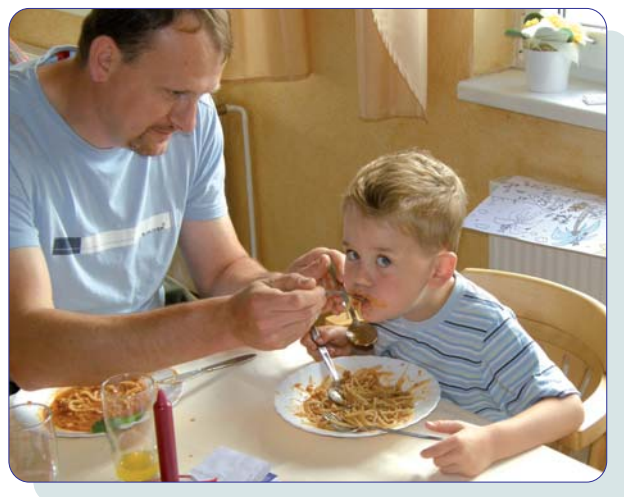
Den Kleinen schmeckt's, die Eltern freut's.